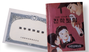
▲ 진학보험 증권 및 상품안내장 (1958)