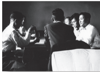
▲ 발기인회의 (1958)