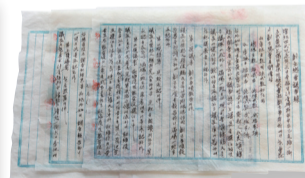
▲ 창립총회 의사록 (1958)